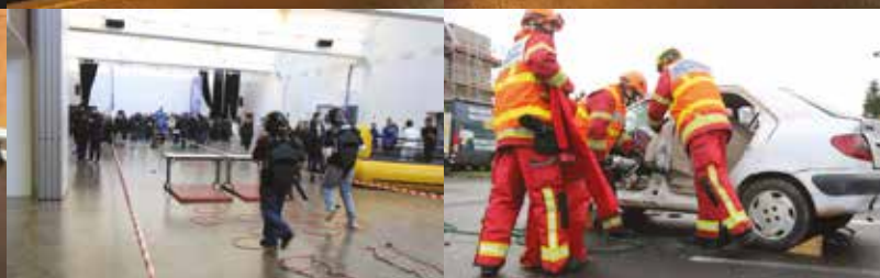
PROX'RAID AVENTURE | 20 novembre | La Manufacture