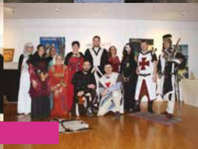
LA NUIT DES LOUPS MAUDITS | Samedi 16 novembre | Médiathèque Jacques Brel