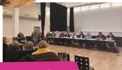
Réunion publique La Chesnaie - 17 décembre 2024

Les réunions publiques ont toutes lieu à La Manufacture et débutent à 20h.