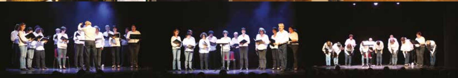
DES SONNETS ET DES ROSES | Dimanche 17 novembre | Théâtre du Thelle