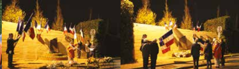
COMMÉMORATION | Jeudi 5 décembre