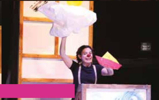
CE MATIN-LÀ | 28, 29 et 30 novembre | Théâtre du Thelle