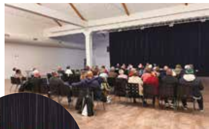
Réunion publique Les Villages 21 novembre 2024

Elles sont d'ores et déjà programmées tout au long de l'année 2025. Prenez date !