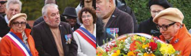
COMMÉMORATION | Lundi 11 novembre