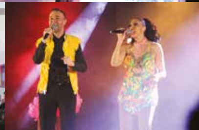
GALA DES SENIORS ET DISTRIBUTION DES COLIS | 2, 3, 4 et 5 décembre | La Manufacture