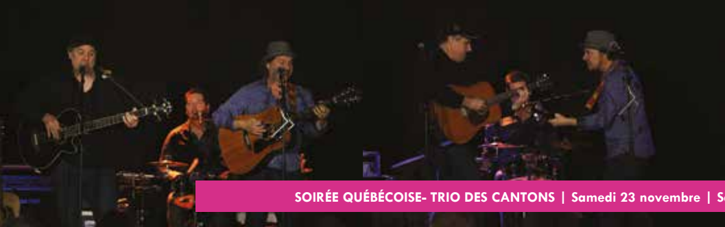
SOIRÉE QUÉBÉCOISE- TRIO DES CANTONS | Samedi 23 novembre | Salle Voltaire