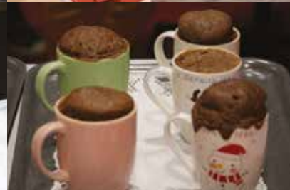
MÉRU C'EST NOËL | Samedi 14 décembre | Centre-ville